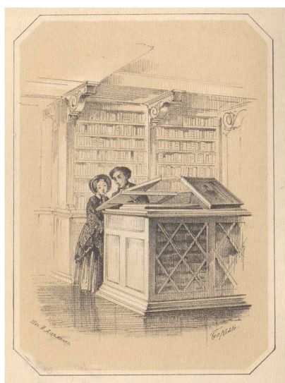
Шкаф-стол для хранения эстампов