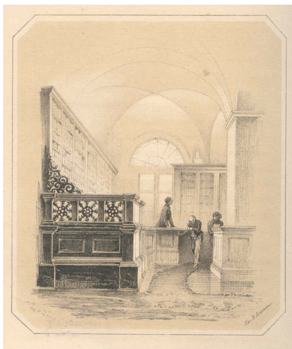
Читальный зал. Эстрада дежурного.

Публика в этот день, по-видимому, не исчезала ни в середине, ни под конец обхода. Кажется, ушли раньше только двое, и то уже из Русского отделения.