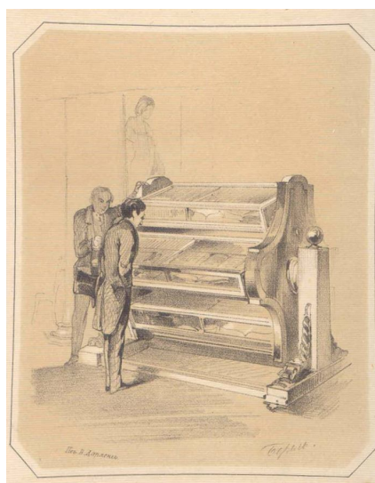
Станок с вращающимися витринами