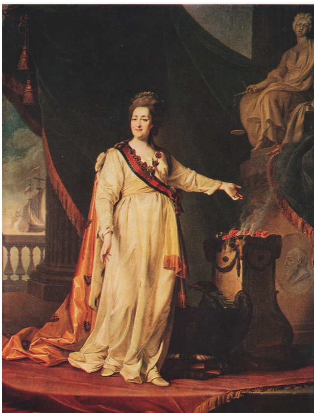
Екатерина II. 1783 год.