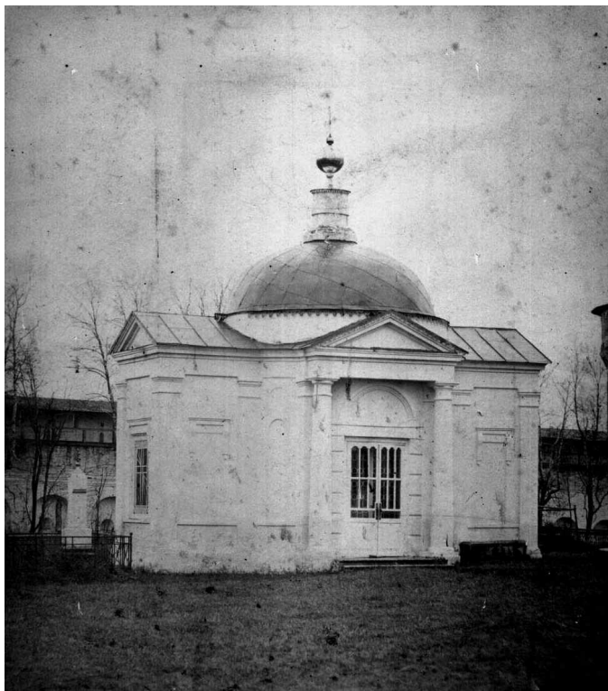
Церковь во имя Святой великомученицы Екатерины и Святого равноапостольного Великого князя Владимира в Спасо-Прилуцком монастыре, Вологда.