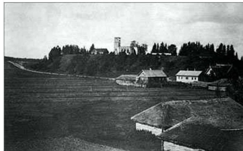
Вид на городище Врев, начало XX века.