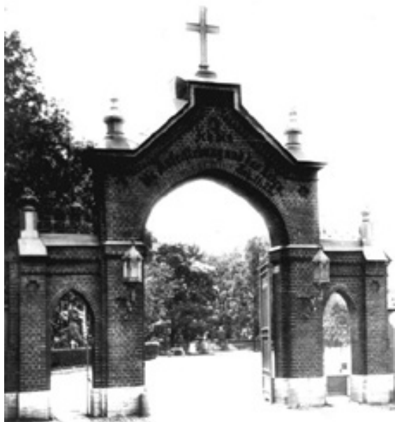
Фото 2. Волковское лютеранское кладбище в Петербурге.

Случилась Октябрьская революция. В январе 1919 года все кладбища были национализированы. Уже в феврале 1919 года началось разграбление Волковского кладбища: деревянный забор, дом смотрителя, и другие деревянные сооружения были разобраны на дрова. Архив кладбища оказался в снегу. Большое спасибо членам общины Св. Петра, которые в суровые дни зимы 1919 года на санках вывезли и спасли 40 книг архива. Вначале они хранились на квартирах прихожан, и только в 1935 году были переданы в Исторический архив в составе Ленинградского областного архивного управления 2 . Благодаря этим самоотверженным людям удалось восстановить фамилии около 80 000 погребенных на Волковском кладбище с 1820 по 1919 год.