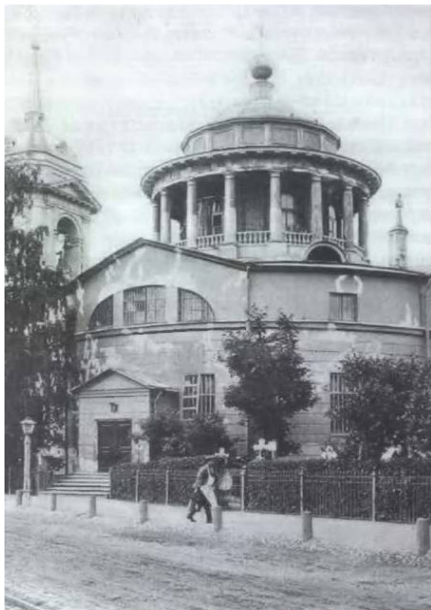
Благовещенская церковь. Открытка начала XX века