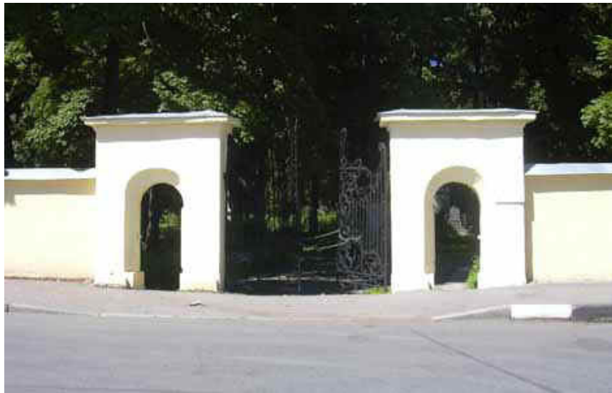
Фото 1. Смоленское евангелическо-лютеранское кладбище в Петербурге.

Германии вышел справочник в двух томах «Deutsche in St. Petersburg» 1 . В 2006–2008 годах автор статьи вновь обследовал кладбище, сфотографировал около 4000 памятников, включая блокадные и послевоенные захоронения. Составлен компьютерный список на 6137 погребенных и фотографий памятников. Подготовлен также алфавитный список захоронений по единственной сохранившейся книге погребенных за 1912–1919 гг. Он содержит 3566 фамилий.