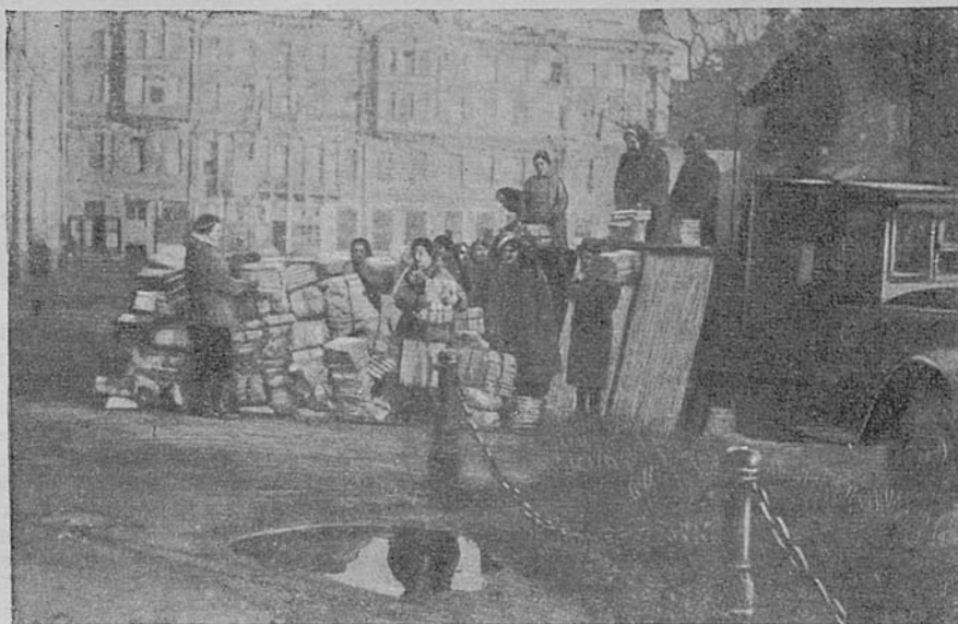
Разгрузка первого вагона литературы, полученного из Москвы. Ноябрь 1943 г.

Значительное место в работе библиотеки за последние полтора—два года занимает создание коллекции «Ленинград в Отечественной войне». В этой коллекции с большой полнотой собрана изданная продукция Ленинграда с 22 июня 1941 года—книги, газеты, журналы, листовки, плакаты, воззвания, открытки, этикетки и другие материалы, знакомящие нас с героической борьбой