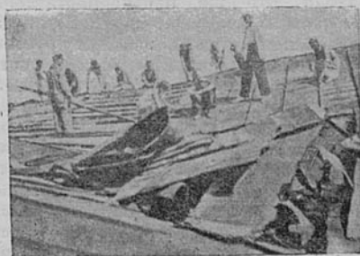
Ремонт кровли главного здания Библиотеки, разрушенного артиллерией. Лето 1943 г.

Свыше 2.000 иностранных журналов и книг получила библиотека за 1943 г. из-за границы. Сократившиеся в период блокады культурные связи библиотеки с научными учреждениями страны вновь возрождаются. Возрастает поток писем из библиотек, научных институтов Союза ССР. Многие ученые, академики, писатели присылают свои труды, созданные в годы войны.