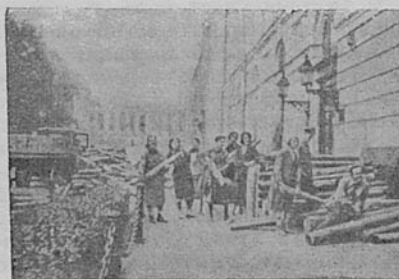
Выгрузка дров сотрудниками Библиотеки для отопления читального зала. Июнь 1943 г.