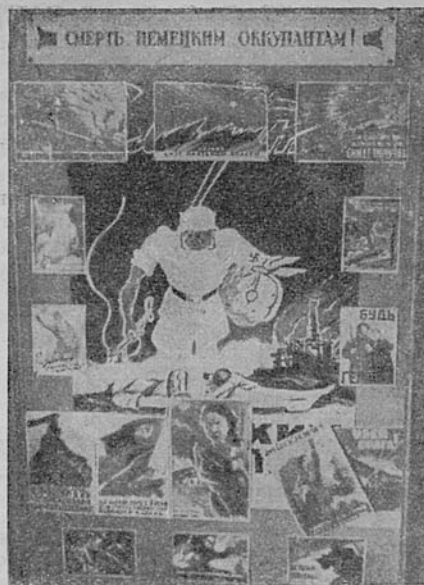
Один из стендов выставки в читальном зале Публичной библиотеки

Частым посетителем Публичной библиотеки являлся В. И. Ленин. В своем гениальном труде «Развитие капитализма