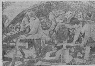
Заготовка дров. За работой сотрудники Библиотеки. Октябрь 1943 г.