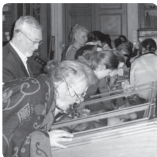
На открытии выставки

властителей. Эти песнопения были записаны в разное время разными нотациями: знаменной, пятилинейной квадратной и современной круглой.