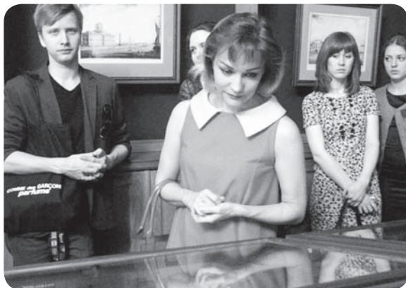
Известная певица, телеведущая и актриса Татьяна Буланова на открытии выставки

а также журналы и альбомы, выпущенные в СССР и в Европе в период с 1945 по 2012 г. Среди них — литература о ведущих дизайнерах, биографии женщин — «икон стиля», описания светских мероприятий, энциклопедия по современному этикету и другие издания.