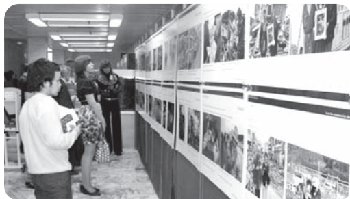
На открытии выставки

На выставке были представлены фотографии, сделанные в районе Тохоку (северо-восточная часть острова Хонсю): деятельность спасателей, прибывших в пострадавшие от землетрясения районы из разных стран мира, в том числе из России; первые дни после трагедии и шаги по возрождению страны; архитектурные красоты и культурные ценности. Все работы были предоставлены Генеральным консульством Японии в Санкт-Петербурге.